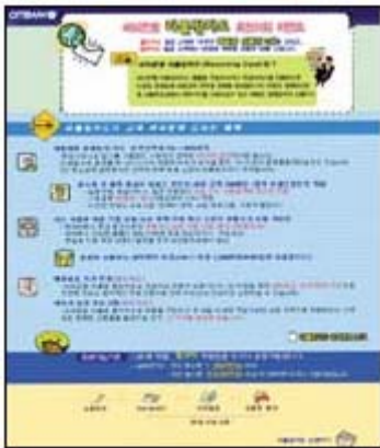
▲씨티은행 온라인 이벤트 페이지

이제 이 프로젝트를 진행한지 4개월이 지나고 있는데, 결과를 살펴보면 몇가지 주목할만한 시사점을 찾아볼 수 있다. 우선 클라이언트 입장에서는 오프라인에서 세일즈 프로모션을 하는 것보다 비교적 저렴한 마케팅비용과 명확하고 과학적인 데이터 관리, DB와 연동된 정확한 타겟마케팅이 된다는 점 등의 장점이 있다.