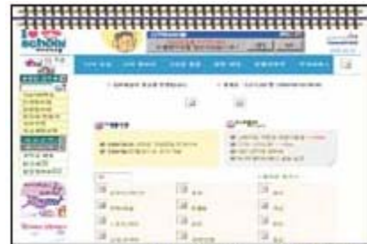
▲인기사이트에 집행된 씨티은행의 웹배너

이 방식은 우선적으로 마케팅 비용이 저렴하고, 효과측정이 과학적이고 확실하다는 장점이 있다. 즉 운영된 사이트별, 마케팅 방법별 효과의 비교측정이 가능함으로써 이후에 어떤 계획을 세울 때 방향성을 정립하는데 과학적으로 접근할 수 있다.